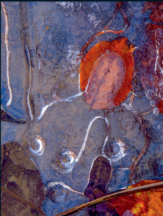
Denis VAUTRAVERS PHOTOS