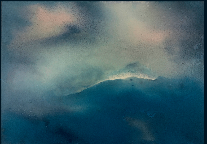
Fabien BALLIF PEINTURE

HORAIRES / VENDREDI / SAMEDI / DIMANCHE / DE 15H À 18H ET SUR RENDEZ-VOUS